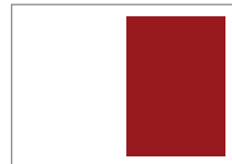
1/2 Seite hoch