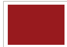
1/1 Seite quer