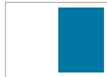
1/2 Seite hoch