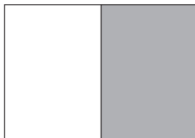
1/2 Seite hoch