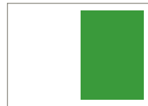
1/2 Seite hoch